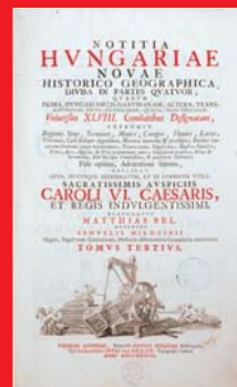
(8) Matej Bel (1684 Džovj - 1749 Bratislava). Študoval Bratislave, Veszpréme a Halle. Pôsobil ako knihaz a rektor evanjelického lycea v Banskej Bystrici a Bratislave. Vynikol v oblasti vlastivedy. Za svoje práce dostal prívlastok Magnum decus Hungariae - Veľká ozdoba Uhorska. Bol členom vedeckých spoločností v Bertine, Londýne, Olomouci a Jene