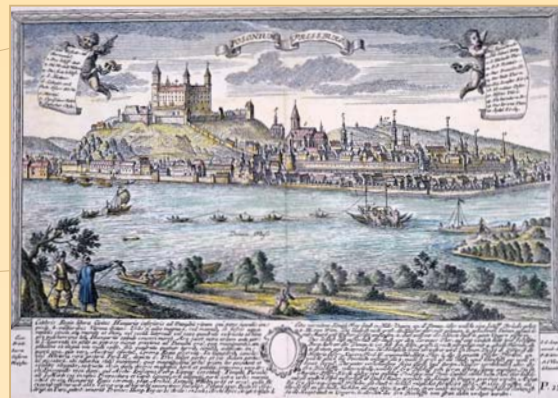
(2) Bratislava z čias Mateja Bela, kolorovaná rytina J. Liopolda, 1738