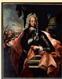
(4) Palatin Ján Pálffy, olej, začiatok 18. storočia. SNM - Múzeum Červený Kameň