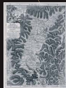
(6) Mapa župy Turiec od Samuela Mikovíneho, 1753. Archív Slovenského národného múzea