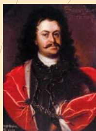
(3) František II. Rákoci, vodca najväčšieho protihabsburského povstania v rokoch 1703 - 1711. A. Mányoki, olej, 1705. Magyar nemzeti múzeum Budapešť