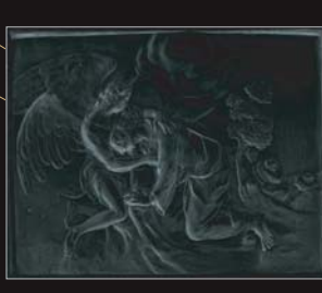
(13) G. R. Donner: Reliéf Olivevna hora v Dóme sv. Martina v Bratislave