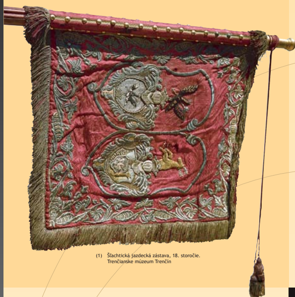
(1) Štachtická jazdecká zástava, 18. storočie. Trenčianske múzeum Trenčín

Koncom 17. storočia boli Turci vytlačení za hranice Uhorska. Mierový život a území Slovenska však nastal až po skončení najväčšieho stavovského povstania v rokoch 1703 - 1711, ktoré viedol František II. Rákoci. Príchod mierových čias vytvoril podmienky pre dynamickejší rozvoj hospodárstva. Znovu ožilo najmä rudné baníctvo, železiarstvo, ale aj remeslá. Naďalej zaostávalo poľnohospodárstvo, kde sa zachovali feudálne vzťahy a tradičné formy výroby. Založené boli prvé manufaktúry, v roku 1722 manufaktúra na súkno v Malackách, 1736 kartúnka v Šaštíne, 1743 manufaktúra na výrobu majoliky v Holiči. Rozvíjalo sa vedecké myslenie a poznanie. Slovensko dalo svetu vedcov európskeho formátu akými bol polyhistor Matej Bel a matematik a fyzik Johann Segner. V architektúre a výtvarnom a úžitkovom umení vznikli pôsobivé diela barokovej kultúry. Slovenská národnosť začala objavovať svoju dávno minulosť a čoraz otvorenejšie sa hlásila k svojej identite. Vitalita Slovákov sa prejavila aj v osídľovaní opustených území Dolnej zeme na rozhraní dnešného Maďarska, Rumunska a Srbska, kde postupne vznikli dediny a mestá so slovenským obyvateľstvom.