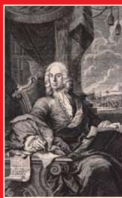
(9) Mateja Bela preslávilo najmä monumentálne vlastivedné dielo Notitia Hungariae novae historico-geographica. Tlačou vyšli v rokoch 1735 - 1742 štyri zväzky. Bolo v nich soracovaných desať stolíc, predovšetkým z územia Slovenska. Ostatné Noticie zostali v rukopise. Frontiscipe 3. zväzku, 1737