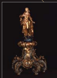
(12) Plastika Mária Immaculata, polychrómované drevo, polovica 18. storočia. SNM - Historické múzeum Bratislava