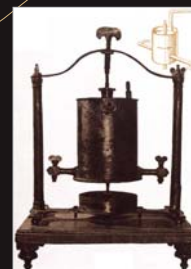
(15) Model Segnerovho kolesa. Koleso založené na reaktívnom pohybe Segner prykrát opísal v roku 1750