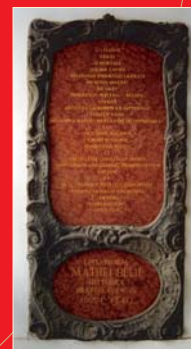
(10) Epitaf Mateja Bela v Bratislave