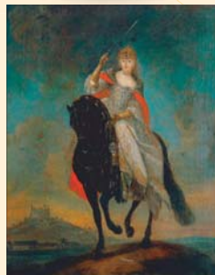
(9) Mária Terézia po korunovácii, dobová otejemalba