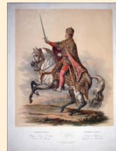
(11) Ferdinand V., posledný uhorský kráľ korunovaný v Bratislave v roku 1830, dobová litografia