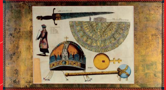
(2) Korunovačné insígnie uhorských kráľov, kolorovaná rytina, 18. storočie