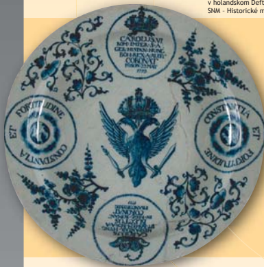
(7) Tanier z korunovačných osláv Karola III. vyrobený v holandskom Delfte, 1712. SNM - Historické múzeum Bratislava