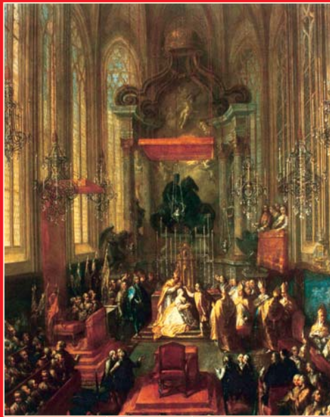
(1) Korunovácia Márie Terézie v Dóme sv. Martina v Bratislave 25. júna 1841

V roku 1536 sa Bratislava (v tom čase nazývaná Posonium alebo Presburg,) rozhodnutím stavovského snemu stala hlavným a od polovice 16. storočia aj korunovačným mestom Uhorska. V rokoch 1563 - 1830 bolo mesto svedkom 19 kráľovských korunovácií. Korunovali tu 10 uhorských kráľov a 9 kráľovien, medzi nimi i významnú panovníčku Máriu Teréziu. Kráľovská koruna a ďalšie kráľovské insígnie boli uschované na Bratislavskom hrade. Miestom korunovácií bol Dóm sv. Martina. Korunováciami si Bratislava upevnila postavenie politického a spoločenského centra krajiny. V roku 1528 bola v Bratislave zriadená Uhorská kráľovská komora ako najvyšší finančný, hospodársky a správny úrad krajiny. Existovala do roku 1848, keď ju nahradili modernejšie ministerstvá. Pre oblasť východného Slovenska plnila rovnakú funkciu Spišská komora so sídlom v Košiciach, založená v roku 1539. V Bratislave sa až do roku 1848 schádzal uhorský stavovský snem. Do roku 1784 bola tiež sídlom Kráľovskej miestodržiteľskej rady zriadenej v roku 1723.