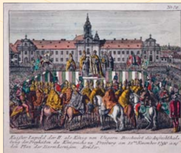
(10) Z korunovačných slávností Leopolda II. v roku 1890