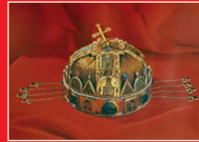
(3) Koruna uhorských kráľov. V súčasnosti je uložená v parlamente Maďarskej republiky v Budapešti