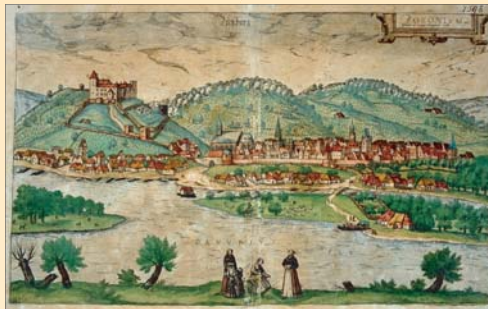
(4) Bratislava koncom 16. storočia, kolorovaná medrytina J. Hoefnagela, 1593