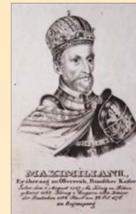
(5) Maximilián II. sa v roku 1563 stal prvým kráľom korunovaným v Bratislave. Dobová rytina. SNM - Historické múzeum Bratislava